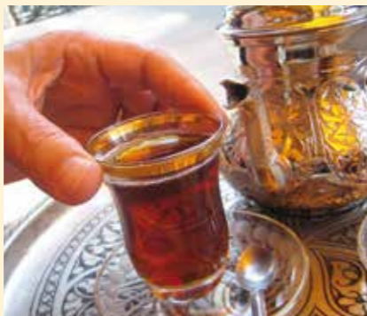
Gastfreundschaft ist ein hohes Gut – vor allem Wüstenbewohner pflegen die alte Tradition.

Doch bleiben wir nicht beim Vergangenen: Eine besondere Form der Gastfreundschaft sind heute die ökumenischen Gottesdienste, die wir in unserer Stiftspfarrkirche regelmäßig mit den evangelischen Christen feiern. Vieles hat sich hier auf gesamtkirchlicher Ebene zum Positiven gewendet: So bekannten sich im März 2017 der vorsitzende Landesbischof der evangelischen Kirche in Deutschland wie auch der vorsitzende Kardinal der deutschen Bischofskonferenz „zur Umkehr von der Jahrhunderte währenden Geschichte gegenseitiger Verletzungen und Abgrenzungen“ – ein Meilenstein in der Geschichte der Ökumene!