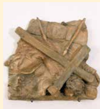
9. Station: Jesus fällt zum dritten Mal unter dem Kreuz