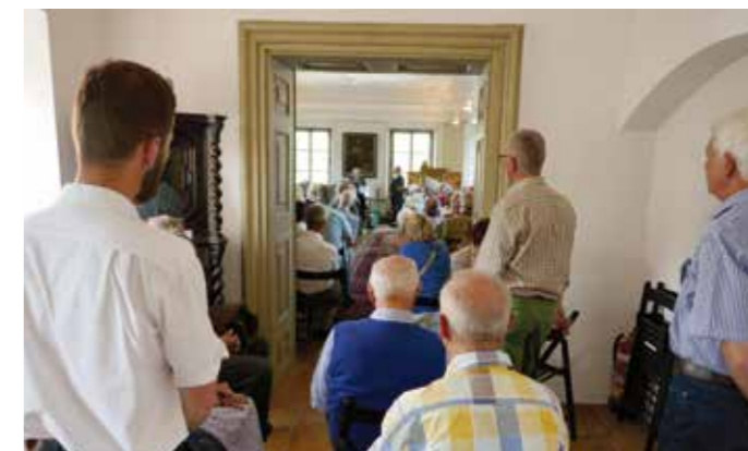
Eröffnung der „Maria Theresia“-Ausstellung im Stiftsmuseum mit einem enorm großen Zuspruch von Interessierten aus Nah und Fern.