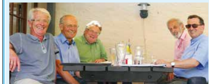
Engagement für Stift und Marktgemeinde – und Freude am Miteinander: Das Bild zeigt Mitglieder des alten – und im November neu bestellten – Vorstands der Stiftsfreunde bei einer sommerlichen Sitzung. Aus den Beiträgen von 213 Vereinsmitgliedern werden seit Jahren wichtige geistige und finanzielle Beiträge zur Unterstützung von Projekten geleistet, die das harmonische Miteinanders von Stift, Pfarre und politischer Gemeinde stärken.