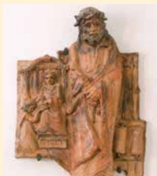
1. Station: Jesus wird zum Tod verurteilt

Im Jahr 2008 wurde er im Kreuzgang der Stiftskirche geweiht: Vinzenz Schreiners Mattseer Kreuzweg. Ein – wie er sagt – „Hinabsteigen und mich Hineinversetzen in den tiefsten Seelengrund“. Selbst Erlebtes hat Schreiner mit eingearbeitet.