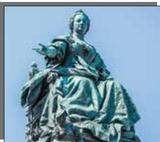
Stiftsmuseum: „Maria Theresia-Ausstellung“ wurde ein Riesenerfolg S. 16–17