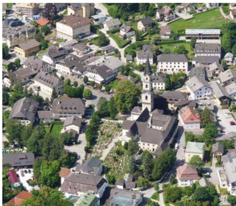
Mattsee aus der Vogelperspektive. Viele der Gebäude im Umkreis von Kirche und Stift dienten über Jahrhunderte hinweg den Kanonikern als Wohnstätten, aber auch als Pfarrhof, als Schule und Unterkünfte für Mesner, Chorsänger – und für Repräsentationszwecke der Stiftspropste.