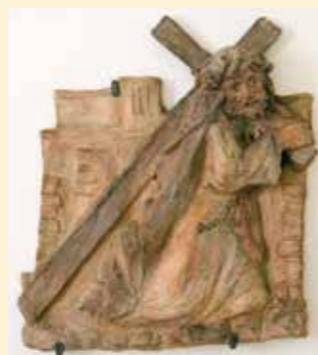
3. Station: Jesus fällt zum ersten Mal unter dem Kreuz