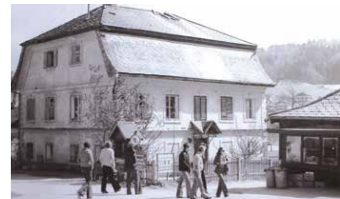
„Doktorhaus“, früher Wohnung bekannter Kanoniker, dann Arzt-Ordination.