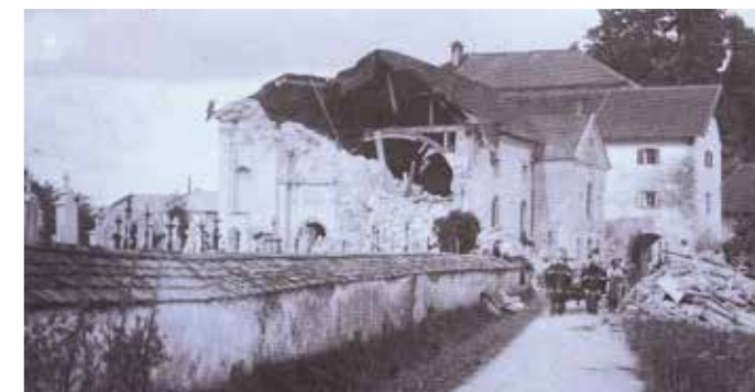
Die Friedhofskirche zum hl. Laurentius nach dem Einsturz des Turmes.