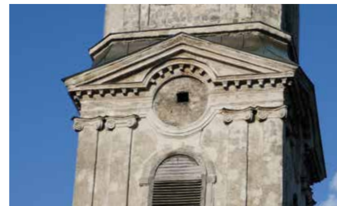
Ein seltenes Bild: Die Turmuhr ohne Ziffernblatt. Zur Renovierung im vergangenen Sommer hat auch der Stiftsverein beigetragen.