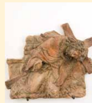
7. Station: Jesus fällt zum zweiten Mal unter dem Kreuz