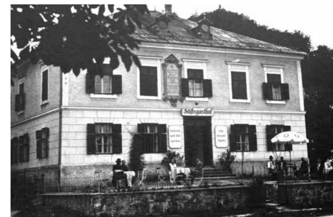
Erst Kanonikerhaus, dann Gasthof, heute Pfarrhof mit Propst-Wohnung.