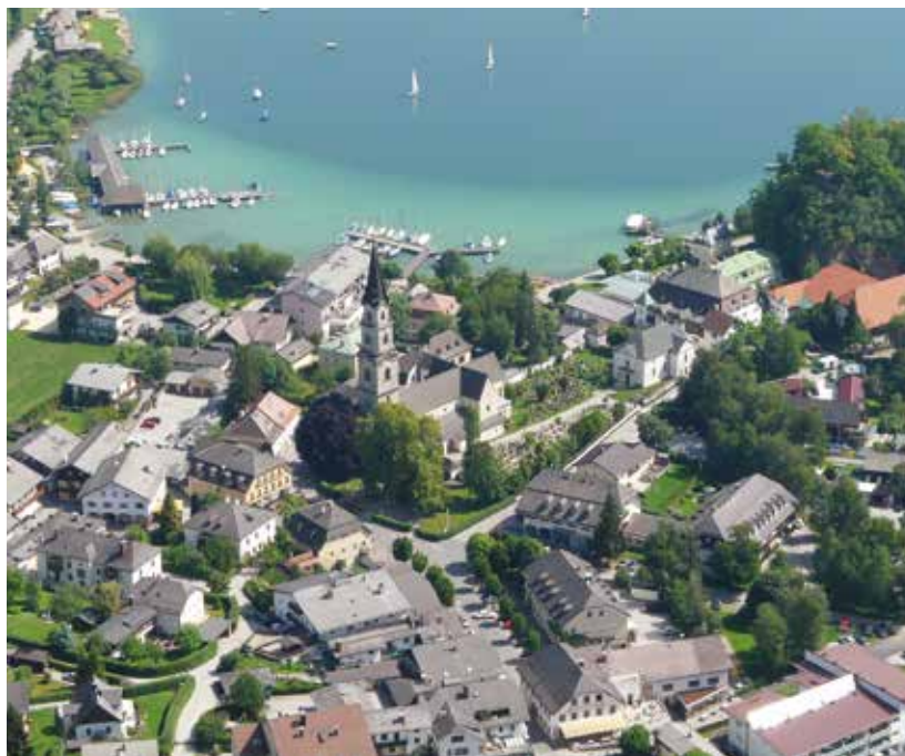
Das Zentrum der Marktgemeinde Mattsee: Die Stiftskirche mit ihrem „Flachgauer Goliath“, die Propstei und zahlreiche „Kapitelhäuser“.

Seit Jahrhunderten sind sie untrennbar miteinander verbunden – religiös, kulturell und in ihrem Ortsbild, ihrer Architektur: Das Collegiatsstift Mattsee und die Marktgemeinde, die im Schatten von Kirche, Propstei und den vielen sogenannten „Kapitelhäusern“ gewachsen ist. Ihnen, den Stiftsbauten, die trotz mancher Verluste den Ort durchwachsen, ist der Schwerpunkt dieser Ausgabe der „Stiftsblätter“ gewidmet (Bericht ab S. 6)