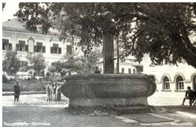
Der Stiftsbrunnen, einst unter zwei Linden – eine steht noch heute.