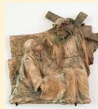
6. Station: Veronika reicht Jesus das Schweißstuch