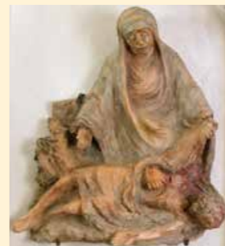
13. Station: Jesus wird vom Kreuz abgenommen und in den Schoß seiner Mutter gelegt