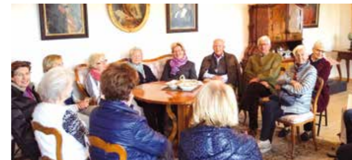
Museumsgespräch über Maria Theresia: Großes Interesse für eine mächtige Frau.