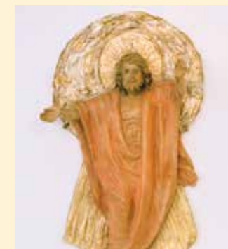
15. Station: Christ ist erstanden von der Marter alle