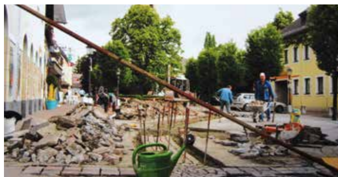
Die ersten großen Umbauarbeiten im Ortszentrum im Frühjahr 1988.