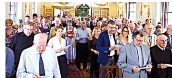
„Ode an die Freude“ zur Eröffnung der „Maria Theresia“-Ausstellung.