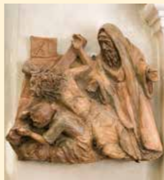
11. Station: Jesus wird ans Kreuz genagelt