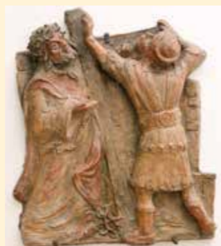
2. Station: Jesus nimmt das Kreuz auf sich