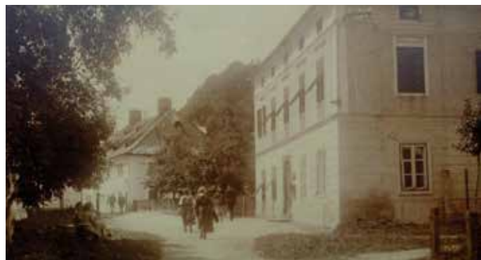
Einst Wirtschaftsgebäude, später Post, heute Pfarrheim St. Michael.