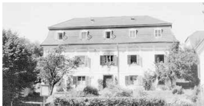
Der barocke Pfarrhof steht nicht mehr und musste einem Neubau weichen.