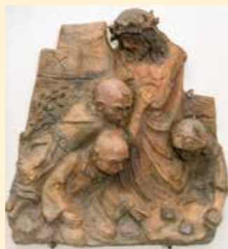
10. Station: Jesus wird seiner Kleider beraubt