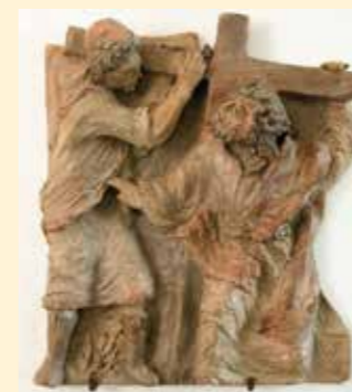
5. Station: Simon von Cyrene hilft Jesus das Kreuz tragen