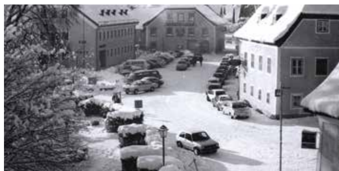
Winterbild: Der Marktplatz, wie er vor 30 Jahren ausgesehen hat.