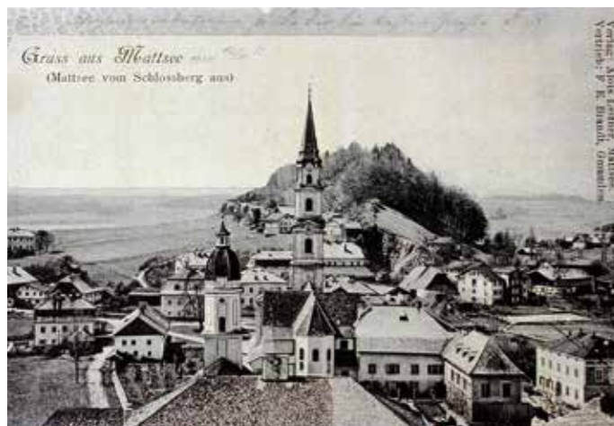
Eine alte Postkarte: Das Mattseer Ortszentrum vom Schlossberg aus.