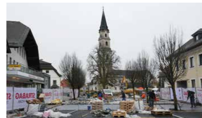
Herbst 2017: Wieder erlebt das Zentrum von Mattsee eine Neugestaltung.