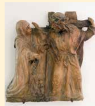
4. Station: Jesus begegnet seiner Mutter