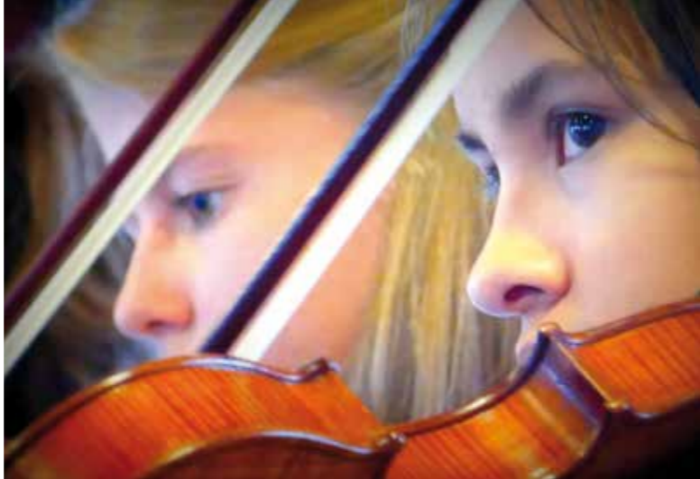
Angesichts der Fülle kultureller Veranstaltungen im Ort (hier die „Young Solists“) haben wir im Sommer 2017 die Reihe der „Sonntagskonzerte“ auslaufen lassen.