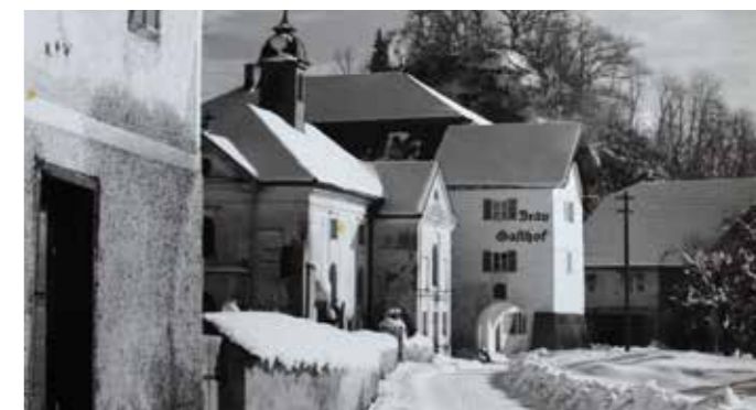
Die Friedhofsmauer, die alte Pfarrkirche – und der „Bräu-Gasthof“.