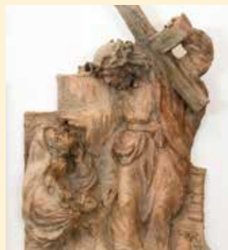
8. Station: Jesus begegnet den weinenden Frauen