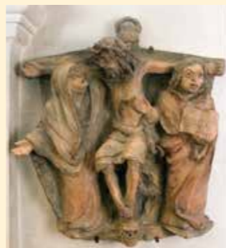
12. Station: Jesus stirbt am Kreuz