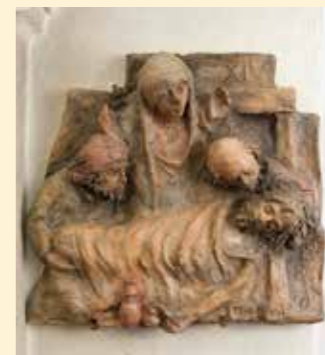
14. Station: Jesus wird ins Grab gelegt