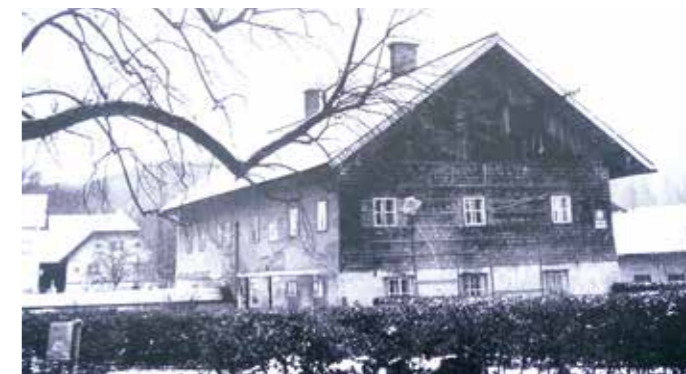
Das „Mesnerhaus“, lange Zeit auch Schule, hier kurz vor dem Abriss 1972.

Das Ortsbild hat für die Marktgemeinde und die Identität seiner Bürger einen besonderen Wert. Damit ist allen, die heute auf eine gute Weiterentwicklung als Heimat und als ein Anziehungspunkt für Gäste Einfluss nehmen können, eine besondere Verantwortung mitgegeben. Dem Kollegiatstift und allen Personen und Institutionen, die bisher in diesem Sinn verantwortungsbewusst ihren Teil dazu beigetragen haben, sei herzlich gedankt.